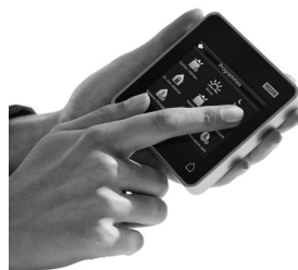
Commande tactile KLR 200

8 programmes de confort déjà enregistrés. Fermeture automatique de la fenêtre en cas d'averse grâce au détecteur de pluie.